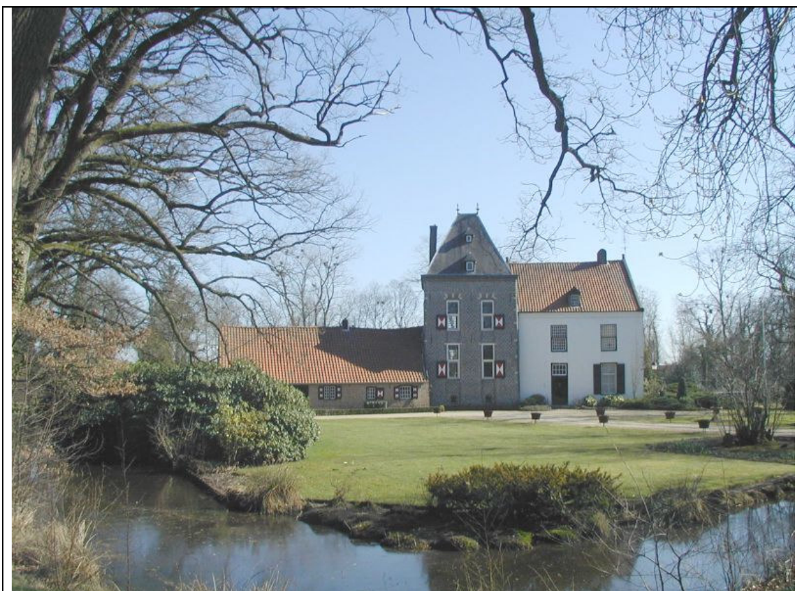
Afb. 2 - Het Klein Kasteel met zijn gracht, maart 2003.

Ook een tijdgenoot van Van der Aa, namelijk C.P.E. Robidé van der Aa, beschreef rond 1840 het Klein Kasteel als “ het zoogenaamde Oude Huis, ook wel Slot van Peelland genaamd ”. 6 Hij haalt in zijn artikel diverse malen Van der Aa aan; we kunnen zeggen dat zijn werk deels op Van der Aa is gebaseerd.