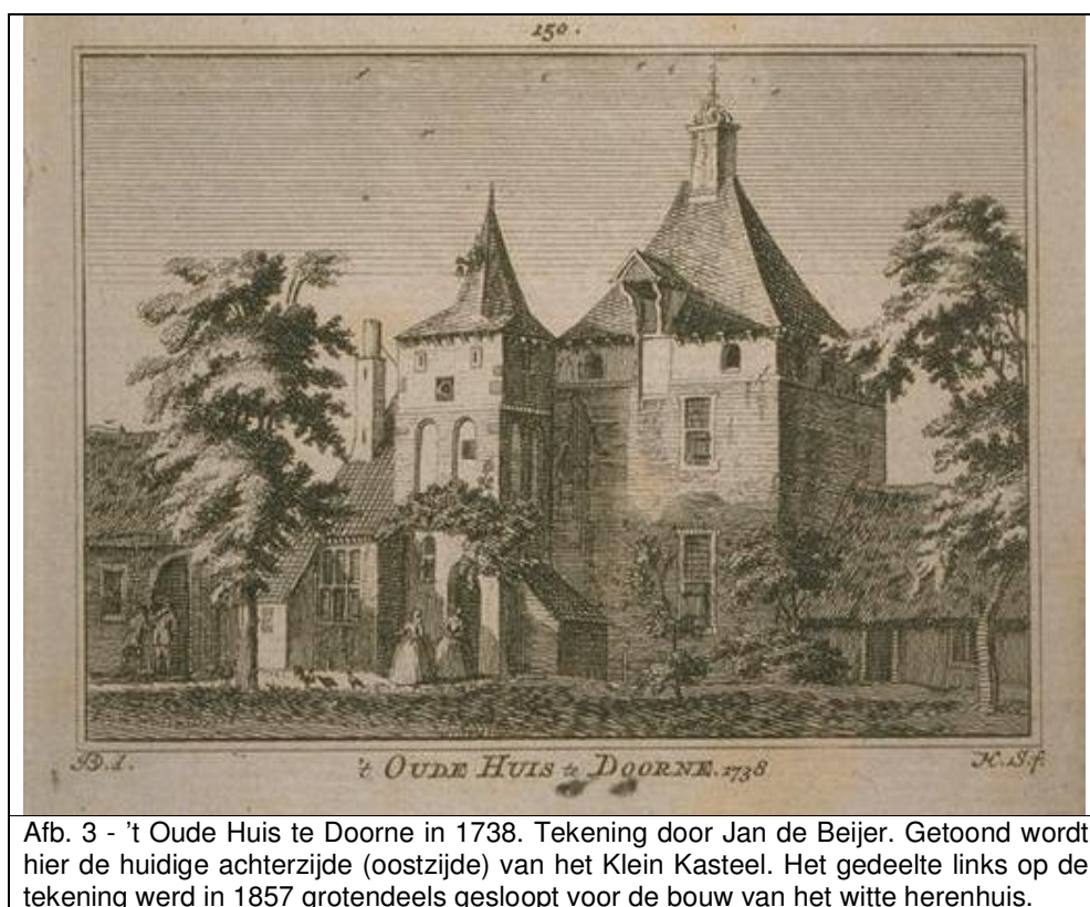
Afb. 3 - 't Oude Huis te Doorne in 1738. Tekening door Jan de Beijer. Getoond wordt hier de huidige achterzijde (oostzijde) van het Klein Kasteel. Het gedeelte links op de tekening werd in 1857 grotendeels gesloopt voor de bouw van het witte herenhuis.

Een verklaring voor Brock’s positionering van het fenomeen “Slot van Peelland” náást het Klein Kasteel is de volgende: men dacht, zo blijkt uit andere bronnen, dat het Klein Kasteel een poortgebouw moest zijn geweest voor dat “Slot van Peelland”. Het Klein Kasteel zèlf kon dus niet met dat Slot geïdentificeerd worden. Aangezien een poortgebouw altijd náást het hoofdgebouw staat, kon men niet anders redeneren dan dat dat Slot naast het Klein Kasteel gestaan zou hebben! Maar, zoals gezegd, het Klein Kasteel wás geen poortgebouw, en het Slot van Peelland heeft niet bestaan.